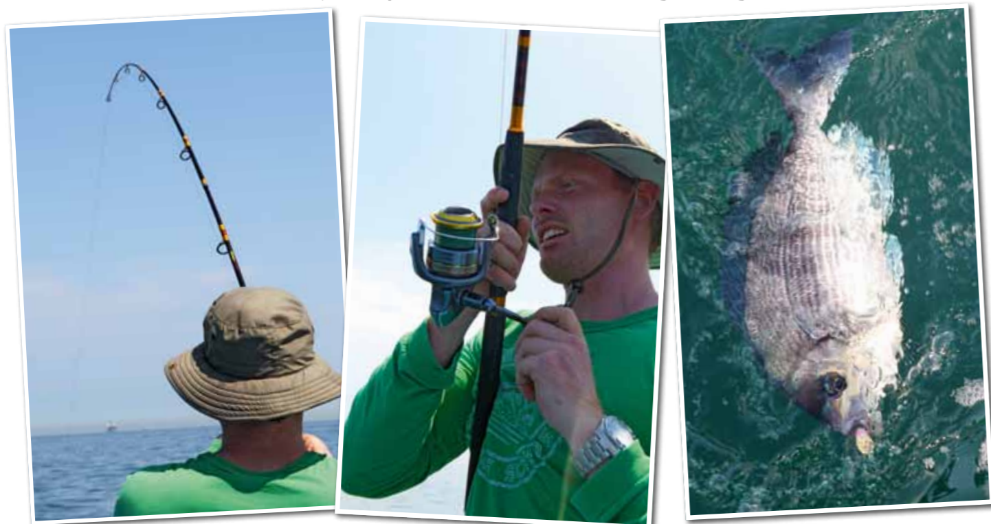
Hoewel relatief bescheiden van formaat, zijn zeekarpers echte knokkers die zich niet snel gewonnen geven.