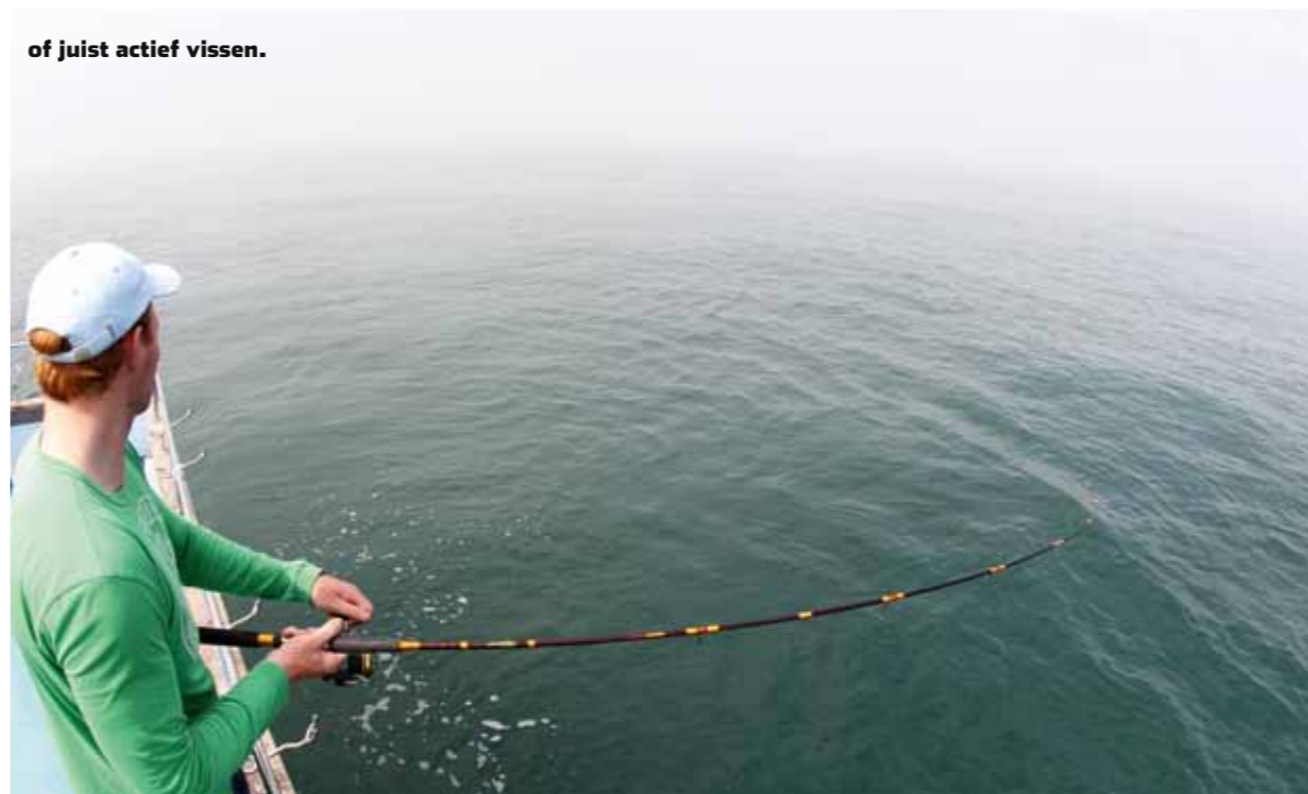
of juist actief vissen.