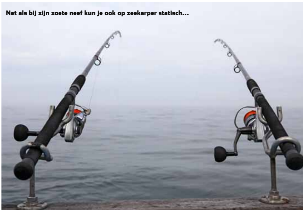
Net als bij zijn zoete neef kun je ook op zeekarper statisch...

melijk vernomen dat schipper Richard Uzeel op wrakkentrips ook regelmatig zeekarper weet te strikken. Als we begin juli aan boord stappen, kijkt die laatste echter bedenkelijk. "Eigenlijk zijn jullie te vroeg. De beste maanden voor zeekarper zijn augustus en september. Of het nu gaat lukken die te vangen is twijfelachtig, zeker gezien het koude voorjaar." Met de haast perfecte weersomstandigheden – vrijwel windstil en